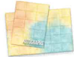
Inserción del autógrafo* ¡Una excelente manera de compartir mensajes con los amigos!

Autograph Insert* $2.00 A great way to share messages with friends!