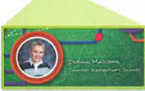
Tapa personalizada El retrato y el nombre de tu hijo impresos en la tapa. Se aplica a tapa blanda o dura

Upgrade to Hard Cover $5.00 A durable cover that will stand the test of time.