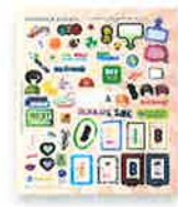
Adhesivos del anuario Adhesivos vibrantes y despegables para personalizar las páginas del anuario

Yearbook Stickys $2.00 Vibrant, removable stickers to personalize yearbook pages.