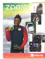
Zoom: Volante de los eventos actuales* ¡Las noticias, los deportes, los entretenimientos más memorables del año y mucho más!

Zoom: Current Events Insert* $3.00 The year's most memorable news, sports, entertainment & more!