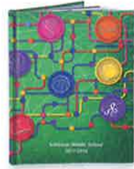
Mejóralo con tapa dura Una tapa durable que perdurará a través del tiempo.

Upgrade to Hard Cover $5.00 A durable cover that will stand the test of time.